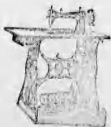
A vidék legnagyobb varrógép raktára. A legtokéletesebb kivitel. 8 évi jótallas.