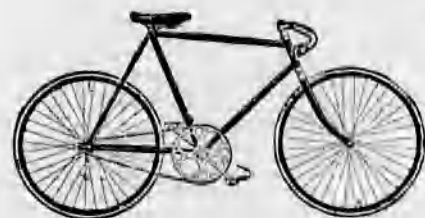
A legtokéletesebb kerékpá- rok. A Premier gépek egyedárusítása.