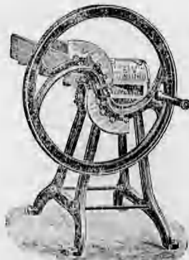
Különféle szecskavágók 44 koronától feljebb.