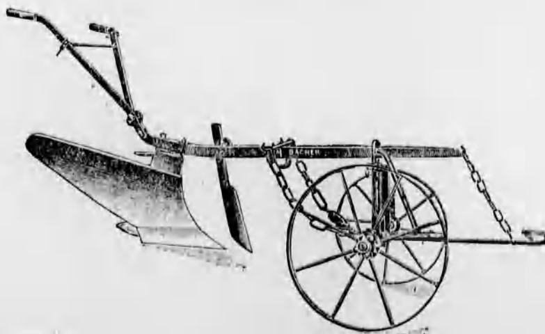
Szakekék minden nagyságban már 48 koroná- tól kezdve.