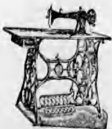
A vidék legnagyobb varró-gép raktára. A leg-tökéletesebb kivétel 8 évi jótallás.

Raktáron tart és a legelőnyösebb részlet-fizetési feltételek mellett árusít mindenféle mezőgazdasági és varró-gépeket, kerékpá-rokat és permetezőket. A leg-tökéletesebb amerikai lókapaló ara-tó és szántó-gépeket.