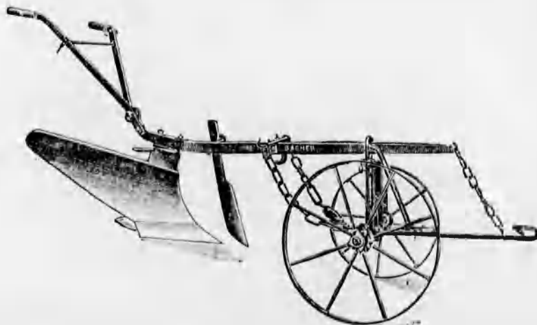
Szakekék minden nagyságban már 48 koronától kezdve.