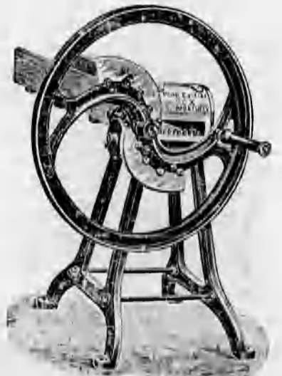
Különféle szecs kavágók 44 koronától feljebb.