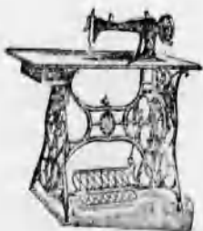
A vidék legnagyobb varrógép raktára. A legtökéletesebb kivétel. 8 évi jótállas.