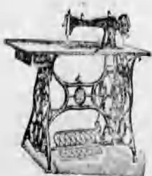
A vidék legnagyobb varrógép raktára. A legtokéletesebb kivétel 8 évi jótállás.