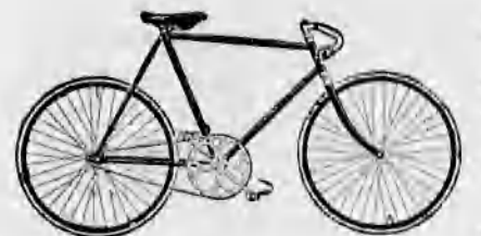
A legtokéletesebb kerékpárok. A Premier gépek egyedárusítása.