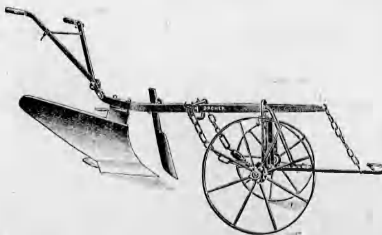
Szakekék minden nagyságban már 48 koronától kezdve.