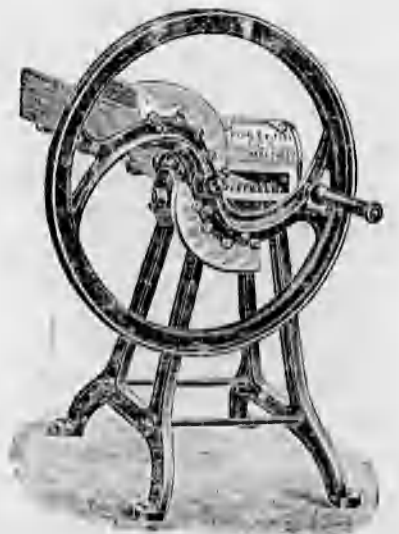
Különféle szecskavágók 44 koronától feljebb.