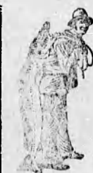
Az Emulsió vásárlásánál a SCOTT-féle módszer vedjéget — a halaszi — kérjük figyelembe venni.

szüntet meg legjobban. A legtisztább alkatrészek, amelyek izletes módon könnyen emészthető krémé egyesítettek a kiváló Scott-féle eljárás által, a