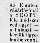
Az Emulsió vásárlásánál a SCOTT-féle módszer ved egyet — a halaszt — kérjük figyelembevenni.