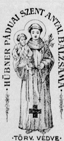
HÜBNER PÁDUAI SZENT ANTAL BALZSAM. TÖRV. VÉDVE.