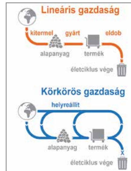
1. ábra: Nyitott és zárt anyagciklusú rendszerek

A körforgásos rendszer elsődleges prioritásai: a hulladékok teljes csökkentése, újrafelhasználása, újrahaználata, újragyártása, javítása. Ugyanakkor megjelenik egy további aspektus is, amely a XX. század