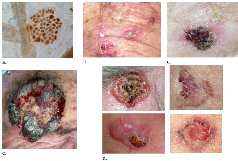
1. ábra Hám eredetű bőrdaganatok: a: p53 pozitív sejtklónok = mikroszkopikus daganat-megelőző állapot (p53 immunhisztokémia), b: actinicus(solaris) keratosisok = makroszkópos daganat-megelőző állapot. c: spinocelluláris carcinoma, d: előrehaladott spinocelluláris carcinoma, e: basaliomák

napfénynek kitett bőrterületeken, valamint az ilyen bőrdaganatok megelőző, úgynevezett prekancerosus (actinikus keratosis) állapotokban és a daganatokban is (1. ábra). Az UV sugárzás karcinogén tulajdonsága széles körben igazolt és ismert, amely folyamat molekuláris genetikai, biológiai megismeréséhez a fentebb említett adatokkal mi is hozzájárultunk.