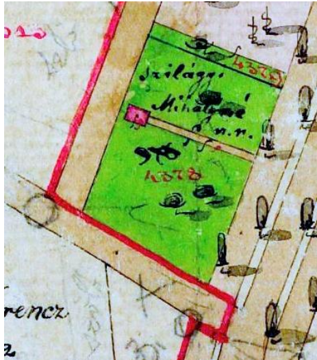
A Sétakert nyugati oldali első kertje és 19. századi épülete

A kataszteri térképlapon látható 376. (fekete) „házszámon”, illetve 4378. (piros) kataszteri számon azonosított telek, a zöld (térképi) színezés szerint teljes egészében kerti művelés alatt állt, a hátsó részen ábrázolt egyetlen építmény és belső útja kivételével. A kert főbejárata a Simonyi úti telekhatár közepén volt, onnan vezetett a barna (térképi) színezésű belső út a hátsó telekrészben – a Sestakertet határoló (Poroszlai) út közelében – berajzolt építményhez. Ez, a hosszabb oldalával a hátsó telekhatárra merőlegesen álló, téglatest alakú ház vörös (térképi) színezést kapott. A korabeli jelrendszerben ez szilárd anyagból készült kő-, illetve a helyi viszonyokban téglaházat mutat.