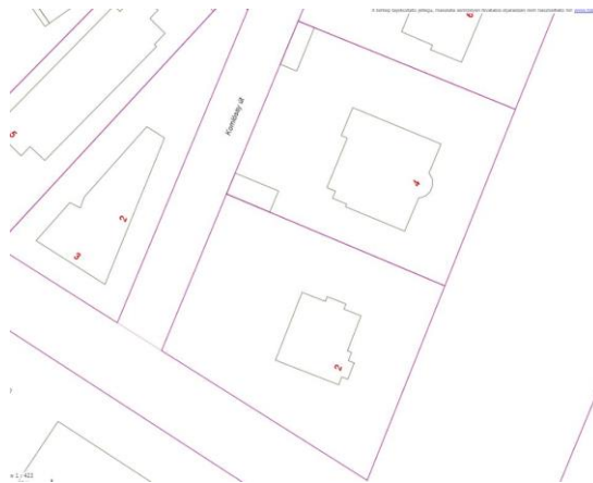
A hatályos szabályozási térkép részlete 7

Az 1898-tól Simonyi út 18. számmal jelölt, kb. 2700 m 2 területű ingatlan a megosztásáig, így legalább 1895-ig lakatlan, és kertként használták. Művelési ága az