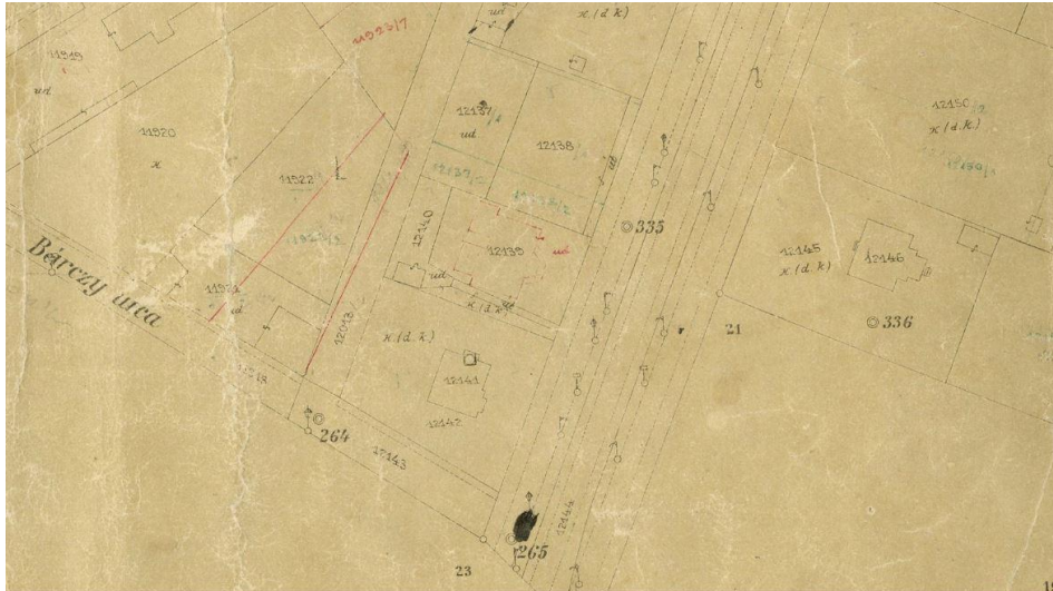
1912. évi kataszteri térkép (189. III. szelvény részlete)