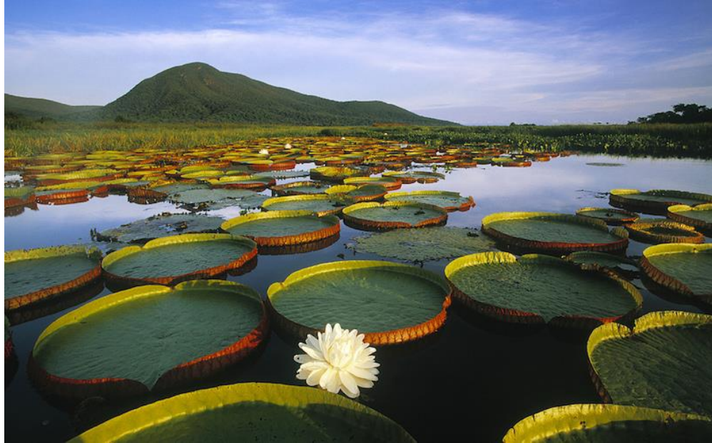
Az érintetlen Pantanal (Brazília).

A Kol Wetland rendszere India (Kerala állam) legnagyobb ramsari területe (1 525 km 2 ). Buja zöld kókuszdióligetekkel és rizsföldekkel szegélyezett folyóival, nagy kiterjedésű tavaival, csatornáival és lagúnáival az egyik legvonzóbb vízrendszer a Földön, egyúttal a világ egyik leggazdagabb madárélőhelye, az ornitológiai turizmus paradicsoma. Ósi hagyományokat őrző, fából készült kenuival, lakóhajóival rendezett versenyei évente sok ezer turistát vonzanak.