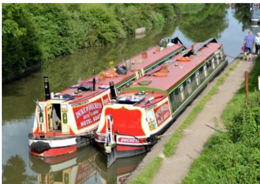
Csatornaturizmus Írországban (Sannon River).

A vizes élőhelyek a kultúrában is jelentősek. Évi félmillió látogató keresi fel Claude Monet impresszionista festőnek a párizsi Marmottan Múzeumban megcsodálható világhírű alkotásainak ihletőjét, a Párizs közelében található