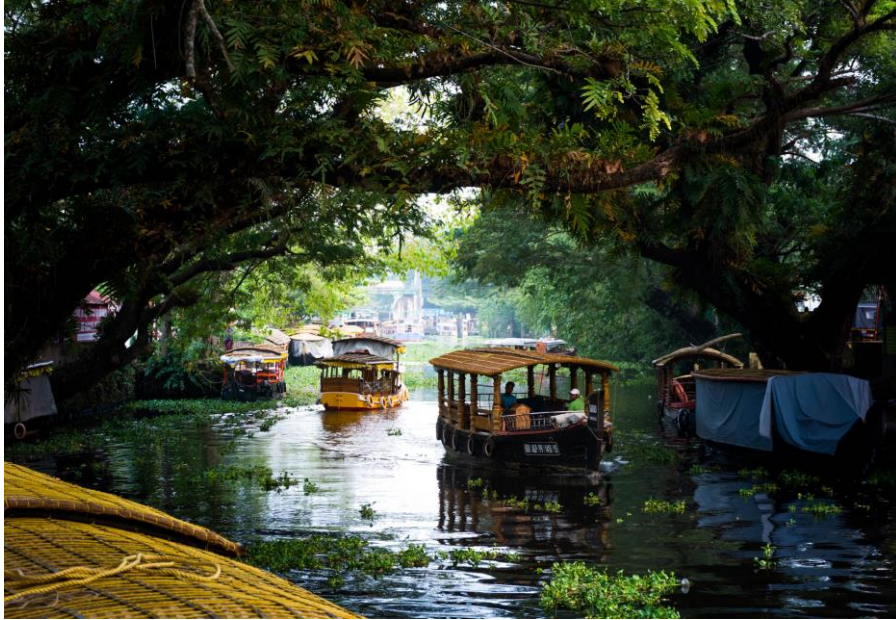
Ökoturizmus a Kol Wetland (India, Kerala állam) ramsari területen.

Az ausztráliai Kuranda (Rainforest, Queensland) természetvédelmi szervezete kimustrált, egykoron katonai szolgálatban állt kételtű járműveket vetett be az extrém 'wetland-turizmus', a különleges élményeket kereső fizető látogatók és a természetvédelmi ismeretterjesztés szolgálatába. A gazdag élővilága által páratlanul látványos világörökségi helyszín egyúttal ramsari terület is.