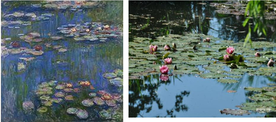
Claude Monet festménye a párizsi Marmottan Múzeumban – és a festőt ihlető Giverny-i Monet-kert.

Givernyt. A művész itt festette a vízi növényekről szóló lenyűgöző sorozatait. A pompázatos kert gazdag növényzettől burjánzó vízfelületei, a tavirózsák, vízililiomok és tündérrózsák több mint 250 remekművéhez szolgáltattak témát.