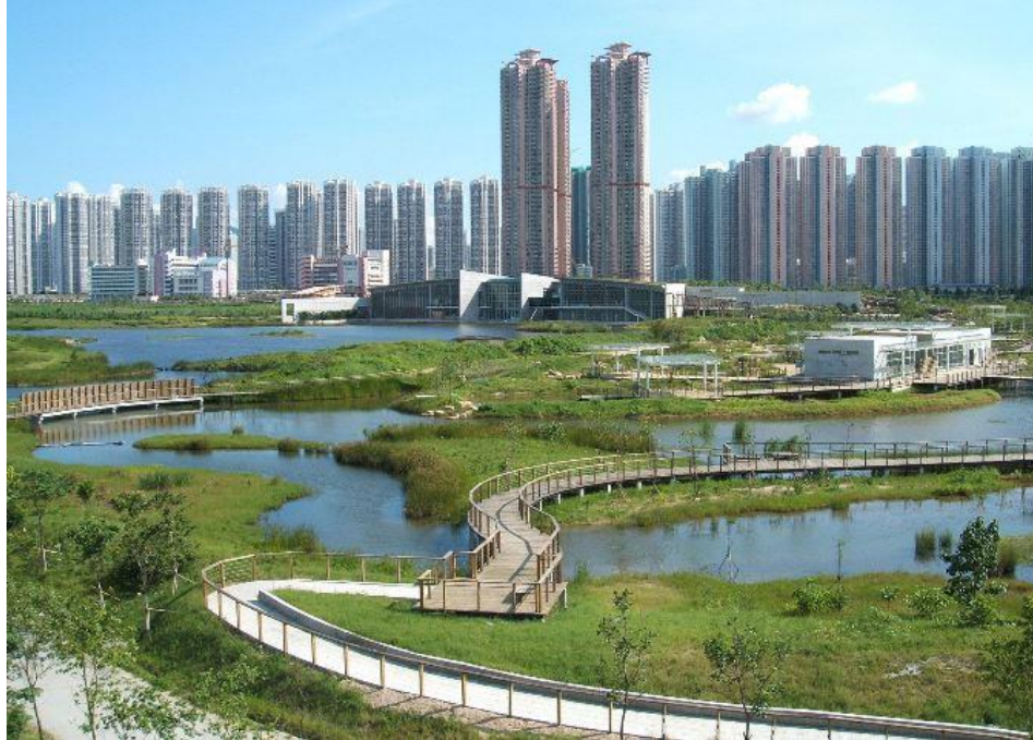
A hongkongi Wetland Park.

A vizes élőhelyek nagyszabású rekonstrukciói, a sok szempontú hasznosítás érdekes példája az Orlando Easterly Wetlands Park (Florida, USA). Nyílt vízfelülete 90 hektár, 200 000 telepített keményfa, 2 millió tő vizinövény telepítésével létrehozott, illetve regenerált mocsári vegetációja Orlando város napi 8 millió gallon tisztított szennyvizét fogadja be (a megengedett kapacitás 35 millió gallon/nap). Mára csaknem 200 madár- és egyéb állatfaj, köztük 30 különösen veszélyeztetett faj élőhelye. A mesterséges vizes élőhely évente több ezer látogatót vonz.