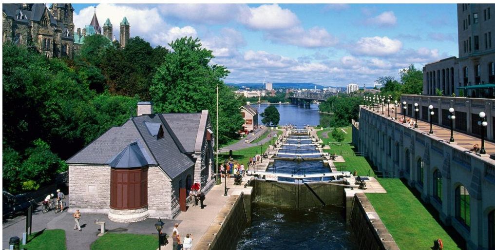
Csatornaturizmus Kanadában (Rideau Canal, Ottawa).