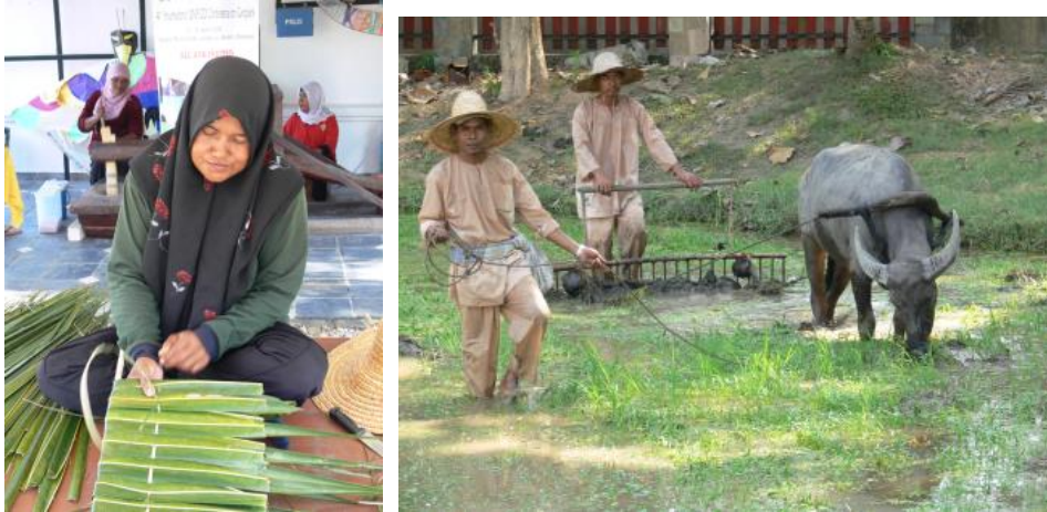
A langkawi rizsmúzeum (Malaysia).

A vizes élőhelyek 2018. évi világnapjának (február 2.) jelmondata: Városi vizes élőhelyek az élhető városokért . A várostervezők és döntéshozók leggyakoribb kérdése: miként növelhetők a városi lakó-, szolgáltató és ipari területek oly módon, hogy azok megőrizték, sőt kedvezően formálják a természeti környezetet, s fenntartható, élhető körülményeket biztosítsanak a lakosságnak? Mindezt annak tudatában, hogy a városi lakosság száma évi 2,4%-kal gyarapodik, s a több tízmilliós lélekszámú városok száma 2030-ra várhatóan 31-ről 41-re nő. Ebben a drámai léptékű urbanizációs folyamatban már napjainkban is különösen fontos szerepe van a vizes élőhelyek megőrzésének, gyarapításuknak. Tudatos tervezéssel, a helyben élő lakosság bevonásával, a mesterséges úton létrehozott több funkciós vizes élőhelyek már napjainkban ragyogóan betöltik szerepüket. Szép példája e törekvéseknek a világon alighanem egyedülálló, mesterségesen kialakított hongkongi Wetland-park létesítménye. A 2006-ban 61 hektáron megnyitott páratlan létesítményt – mesterségesen létrehozott édesvízi mocsarak, patakok, mangrove-erdők, mezőgazdasági területek, halastavak, nádasok, pillangókert, úszó sétány, madárház, krokodilház, kétszintes látogatóközpont interaktív gyerekprogramokkal, madármegfigyeléssel, szabadtéri oktatási központ tantermekkel, laborokkal – napjainkig több mint 3,5 millió fizető látogató kereste fel.