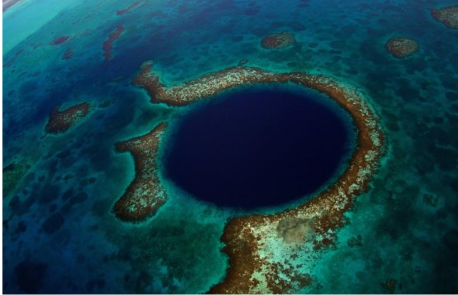
Kagylózátonyok Tasmánia partjai közelében.

A hagyományőrző turizmus is egyre jelentősebb, mint például a ma is élő, ősidők óta alkalmazott halászati módszerek és eszközök bemutatása , a halpiac programkínálatával, vízi tanösvénnyel (pl. Niger-delta, halászat a Chilika Lake ramsari területen, Indiában), másutt a sekélytengeri, part menti sólepárlással (a bulgáriai Pomorie, Sós-tó – hagyományos, élő kézműves mesterség, mint turisztikai látványosság), az 'élő múlt' megismertetésével halászbárkákon Sao Tomé és Príncipe szigetén.