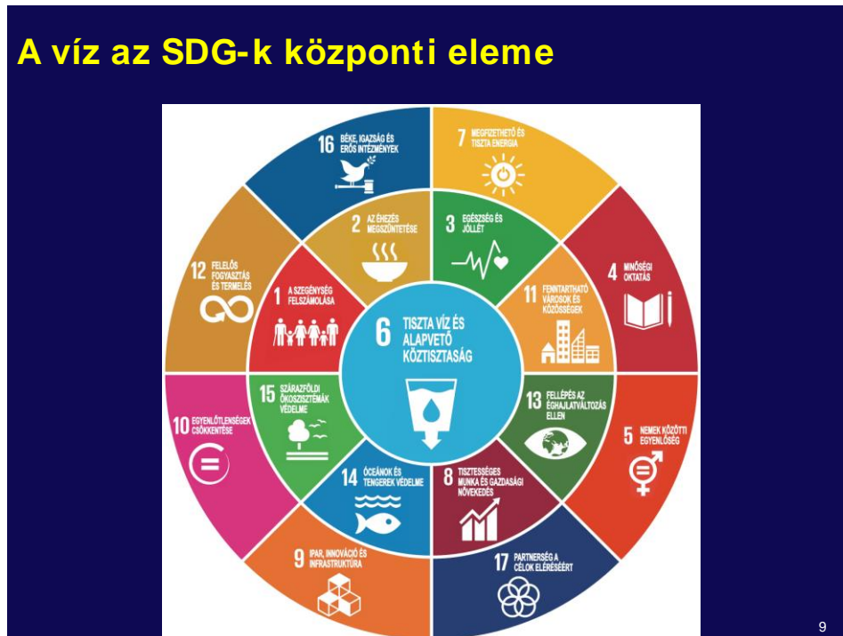
1. ábra. A víz, mint a fenntartható fejlődési célok központi eleme.

butyuta 'kismemzetállamoskodás' a globálizáció korában, a befelé fordulás, az idegengyűlölet (xenofóbia) ellenirányú folyamatokat idéz(het)nek elő. Mindenesetre a víz az, ami a maradék 15 célt összeköti, mint azt a bevallottan szubjektív elrendezésű 1. ábra szemlélteti.