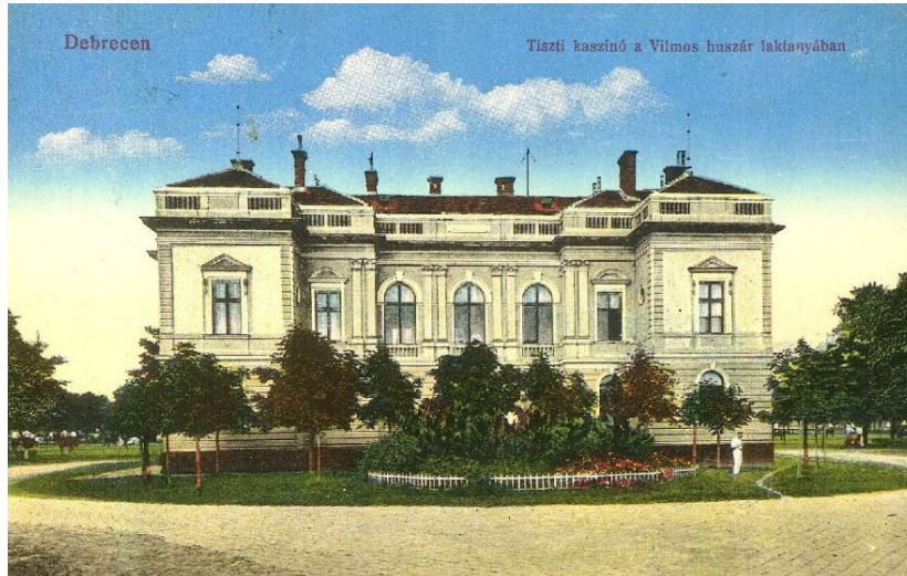
4. kép Korabeli képeslap: Tisztis kaszinó a Vilmos huszár laktanyában. A mai Gazdasági Főigazgatóság épülete.