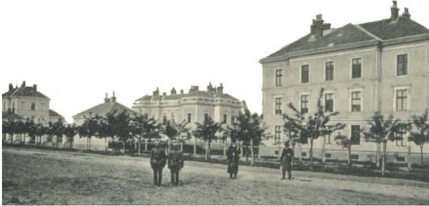
2. kép A Vilmos huszár laktanya a 20. század elején.

A képet korabeli képeslap felhasználásával a szerző szerkesztette (Bakó Irén gyűjtése): http://picasaweb.google.com/lh/photo/ILVJTocItQ076xEFFpaYmw , letöltés ideje: 2012.03.27.).