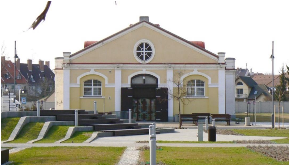
8. kép A Lovarda mai állapotában.