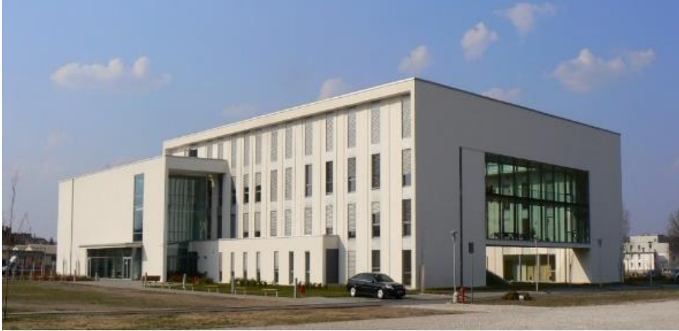
9. kép Az Informatikai Kar a Kassai út irányából.