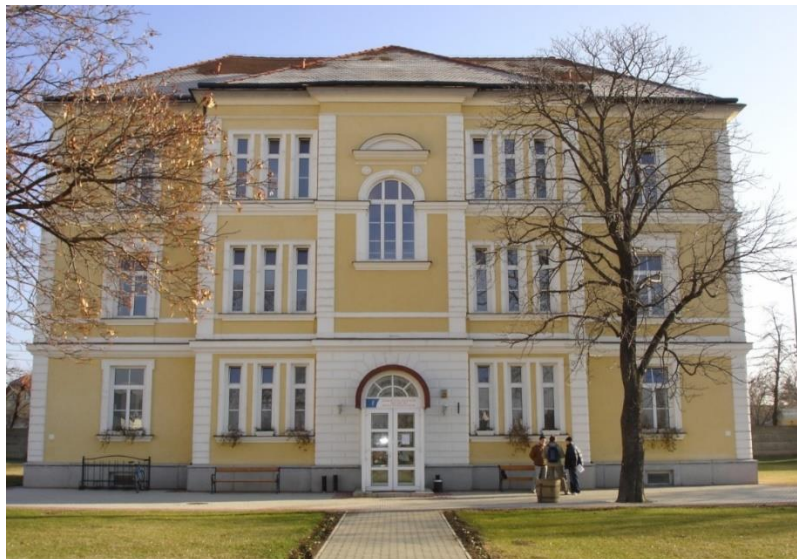
5. kép Az egykori altiszti épület belső homlokzata.