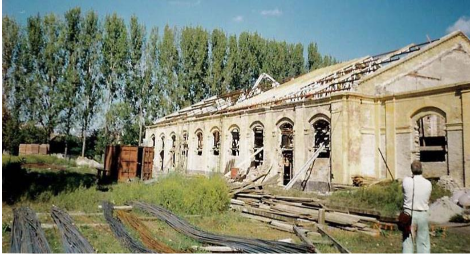
7. kép A Lovarda a felújítás alatt.