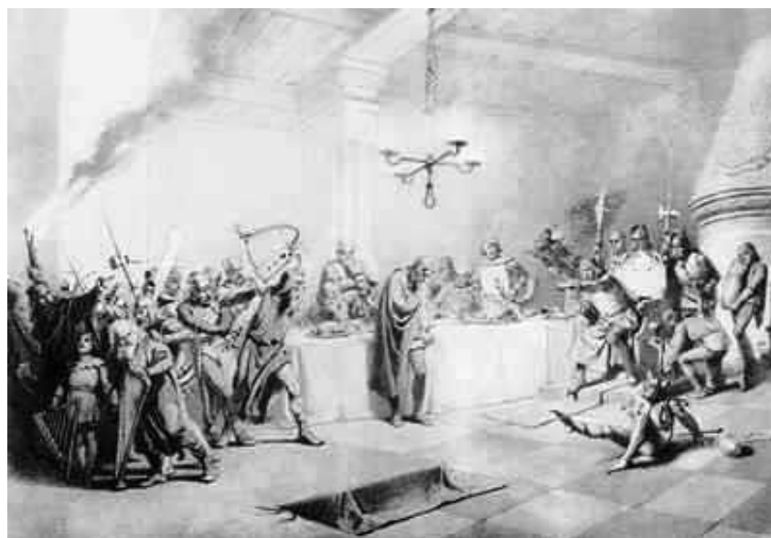
Zichy Mihály: Illusztráció a Walesi bárdokhoz

A Boosey&Hawkes kiadó honlapjának részlete