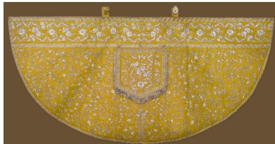
3. kép: Mária Teréziától kapott palást.

A kötet egészéről azt mondhatjuk, hogy az eseményhez és a gyűjteményhez méltó kivitelben készült el. A kiállítási installáció kitűnően sikerült. A tárgyakról precíz leírásokat és kifogástalan minőségű felvételeket találhatunk. Használatával sokkal inkább kitárulnak szemünk előtt a bemutatott darabok részletei és titkai. Talán az ötvösmunkákhoz készülhetett volna olyan általános bevezetés, mint amilyen a liturgikus textíliákat mutatja be. Azt pedig különösen sajnálhatjuk, hogy a katalógus nem készült el a kiállítás megnyitójára, mert bizonyosan sokakat segített volna a bemutatott darabok megismerésében és megértésében. Megjelentetése azonban így is méltó módon segíti elő az emlékezést a korábban látott kiállításra. A két püspökséget és a Déri Múzeumot, a katalóguson dolgozó szakembereket természetesen így is elismerés illeti, hogy a kálvinista Rómába elhozták és bemutatták ezt a páratlan szépségű gyűjteményt.