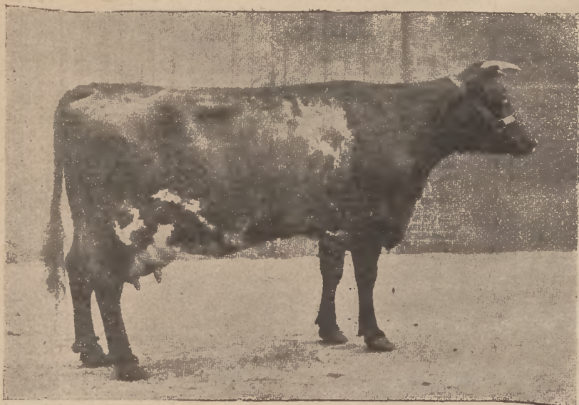
98-ik ábra. Shorthorn tehén: Sherwood Rose 2. 3 ezüst serleg nyertese.