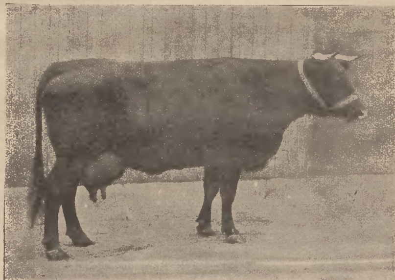
101-ik ábra. South Devon tehén: Sunbeam's Bluebell. A dél Devon tehenek győztese a tejelő és vajversenyben.

A tejelő és vajverseny nyertői a londoni Dairy Show-n tejelő kiállításán és versenyen.