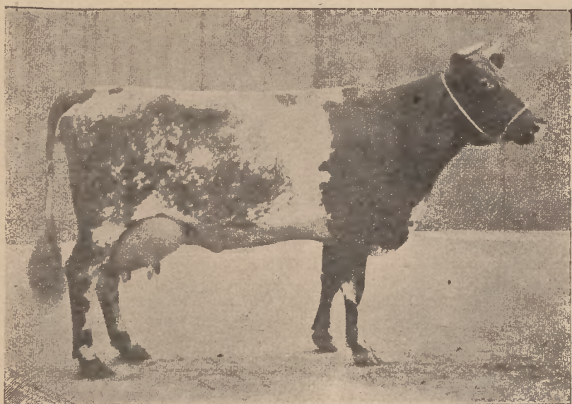
100-ik ábra. Shorthorn tehén: Ruby. A tejelő verseny legtöbb pontot nyert, az ezüst és a Shorthornok vajversenyének ugyancsak ezüst serleg győztese.