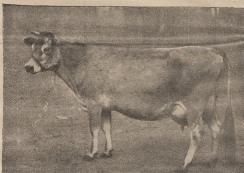
99-ik ábra. Jersey tehén: Promise. Aranyérem a vajversenyben.