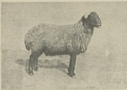
1-6 ábra. Eredeti karakul Boszniából.

A »Gazdasági Lapok« december 23-iki számában olvasok egy rövid ismertetést az ultenvölgyi marháról. Bátor vagyok megjegyezni, hogy abba egy kis tévedés eszszott