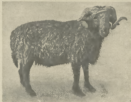
2-ik ábra. Eredeti karakul Oroszországból.