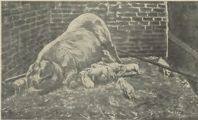
3-ik ábra. Sarokrudak vasból, a malacok agyonnyomása ellen

nál 5 dekával, mindaddig, míg teljesen fel nem eszik egész portiójukat. Így módon hizalva, elejével éheznek a sertések, mohón ez zik az eleséget s alig várják, mikor jön már az etetés ideje, a vizet is csak úgy habzsolják s ezen jó étvágyuk rendszeren meg marad jó hosszú ideig, úgy, hogy biztosra lehet venni, miszerint még a 25-ik héten így elfogyasztják az abrakot, de már egy a 30-ik felé kissé alább hagyunk s akkor elérkezett a fent czeltet redukáló ideje. E szerint 34—35 hét (8 hó) alatt a sertés teljesen kihizik s igényel összesen: 4 q 415 kg., vagy legfeljebb 45 q abrakot. 8—9 hónapos küldök ez idő alatt felhiznak 160—180 söt 200 kg. elősúlyra is. Persze kell megfelelő só-adagot is keverni az abrakba és a vízbe, nem azt egy kis fa- vagy kősenet is tenni, söt néme yek néha egy-egy kis darab vasgálcsót is tesznek bele. Az abrak miből álljon, az most a kérdés? Sokan tisztán kukorikozóval hizlálnak, de ezt nem ajánlom, mert egyféle erőtakarmányt hamarosan megújítják ám. Várkonyban az eleség \frac{1}{2} része árpadara, \frac{1}{2} ré ze tengeri-dara és ehhez lesz \frac{1}{2} rész szemes-tengeri keverve, így jól megrágya jön a gyomorba a takarmány s ott könnyen megemésztetik; de meg is kell rágni is a sertéseknek s ennélfogva nyált vá-