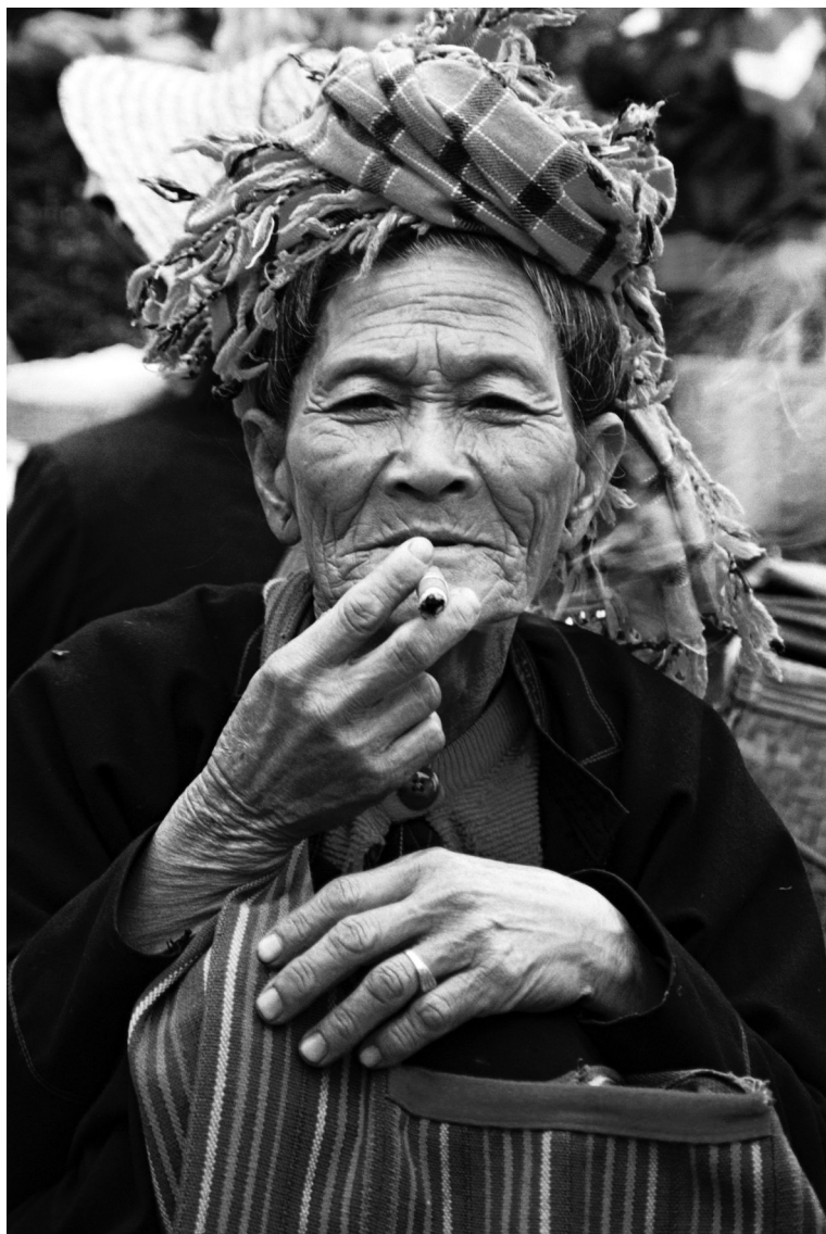
A hosszú élet titka? (Burma)