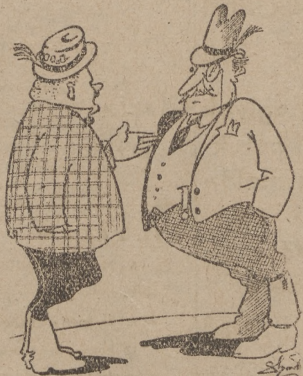
— Mond, kéchick, volt szavazati jogod? — Volt, kéchick! — Hm, hm. Pedig egész becsültes embeinek látszol.

A tervezdálkodás eredményes mielőbbi megindítása mellett nemzetközi érdeklünk is azt követeli, hogy a munka kormányának élén 100 kommunista képviselő miniszterei állanak, megkezdje működését. (hgy)