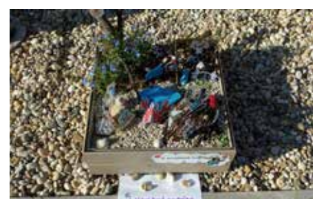
Kiserdei Óvoda kiscsoport