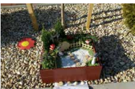
Kiserdei Óvoda nagy csoport