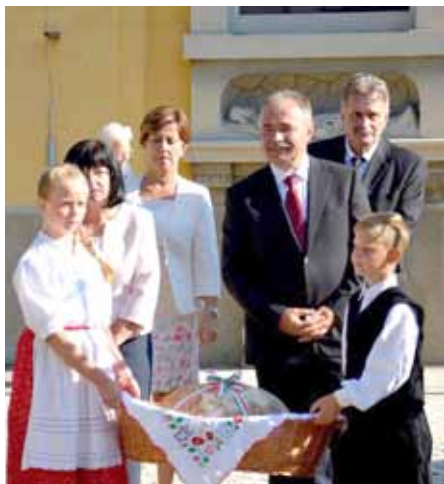
ÚJ KENYÉR ÜNNEPE