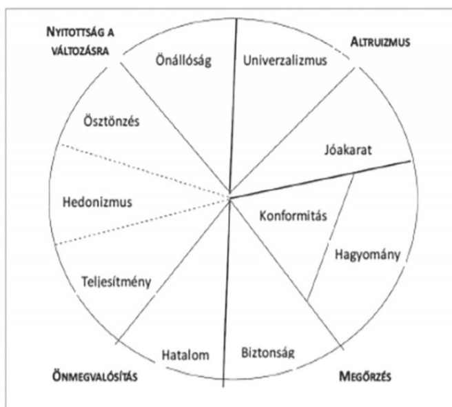
2. ábra. A tíz motivációs értéktípus közötti kapcsolat elméleti modellje (A Schwartz-féle értékdimenziók)

Rokeach munkásságára alapozva Shalom Schwartz (1992) új értékelméletet épített fel, de bevezetett egy olyan elméleti perspektívát, amely az értékek közötti motivációs különbségeket vizsgálja. Shalom Schwartz (2012) kultúra független, univerzális alapértékek kidolgozására törekedett. Tíz olyan motivációs szempontból eltérő alapértéket határozott meg az emberek értékorientációk szerinti jellemzésére, amelyeket az emberek minden kultúrában elismernek (2. ábra). Mindez nem azt jelenti, hogy Schwartz Rokeach munkásságát, minden eredményével együtt megcáfolta volna. Sőt, az új modell bevezetésével az értékekről alkotott megelőző ismeretek sem alakultak át végérvényesen. Az értékutakat általában nem falszifikálják vagy cáfolják meg. Mikor újabb, pontosabb mérési módszerek jelennek meg a korábbi elméletek lassan eltűnnek, kikopnak a tudomány mindennapos gyakorlatából és helyüket egy új elmélet váltja fel, ahogy ebben az esetben is történt.