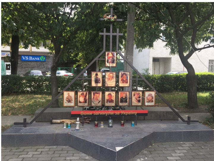
4. fotó. Az ATO katonák emlékműve, Nagyszőlős (2017. július)

A dekomunizáció kárpátaljai vonatkozásai közül az ATO katonákra emlékező utcaelnevezéseket emeljük ki. Egyrészt, mert sajtóbeszámolók alapján 21 Kárpátalja az egyetlen olyan ukrajnai megye, ahol minden, a térségből származó elhunyt ATO katonáról megemlékeztek a köztérben, azaz utcát, parkot neveztek el róluk (vagy folyamatban van az átnevezés) több esetben emlékművön örökítették meg nevüket és arcképüket (4. fotó). Másrészt úgy véljük, hogy a településről származó elhunyt ATO katonákra való emlékezés hozzájárulhat a Kárpátaljától távol zajló háború helyi narratívájának kialakításához, megteremtve a helyi hősök panteonját. 22