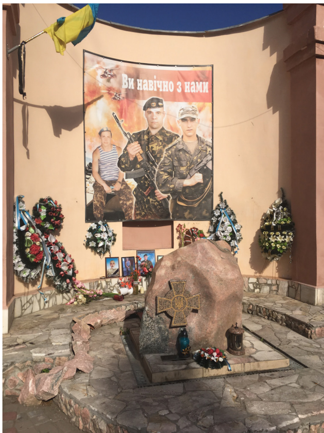
6. fotó. A Beregszászi járásból származó ATO-ban elesettek emlékműve Beregszász főterén.

Kutatásaink alapján úgy véljük, hogy Kárpátalján mind a dekomunizációs törvény végrehajtása során zajló köztérátnevezések, mind az ATO helyi hőseire való emlékezés azt bizonyítja, hogy a helyi szint képes a központi emlékezetpolitikát saját képére formálni. Az adott település, régió jeles történelmi személyiségeire vagy az ATO helyi áldozataira való emlékezés révén az Euromajdan utáni, a szimbolikus tér átformálására irányuló, Kijevből elrendelt átalakulás Kárpátalján a helyi örökség részbeni újrafelfedezését, gazdagítását és köztérben való megjelenítését is lehetővé tette.