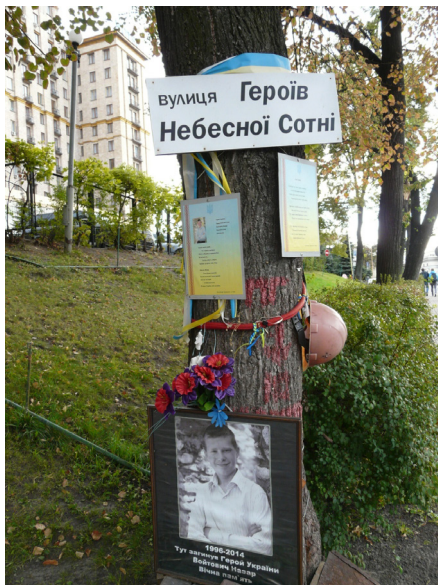
2. fotó. Utcanévtábla a Mennyei Század Hősei utca egy szakaszán. A fotók és virágok személyessé és élővé teszik a különböző emlékhelyeket (Kijev, 2016. szeptember)