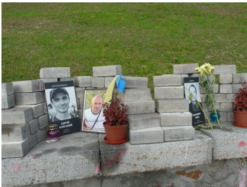
1. fotó. Részlet a Majdanon elesettek tiszteletére emelt emlékműből. Az áldozat arcképe mellett rövid ismertető olvasható életéről (Kijev, 2016. szeptember)