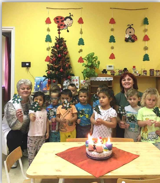
Advent az óvodában