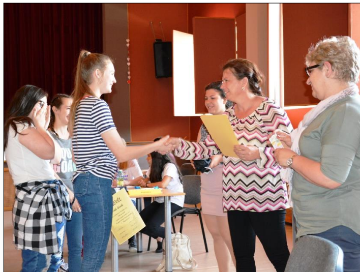
A verseny győztes csapata átveszi az oklevelét a szervezőktől