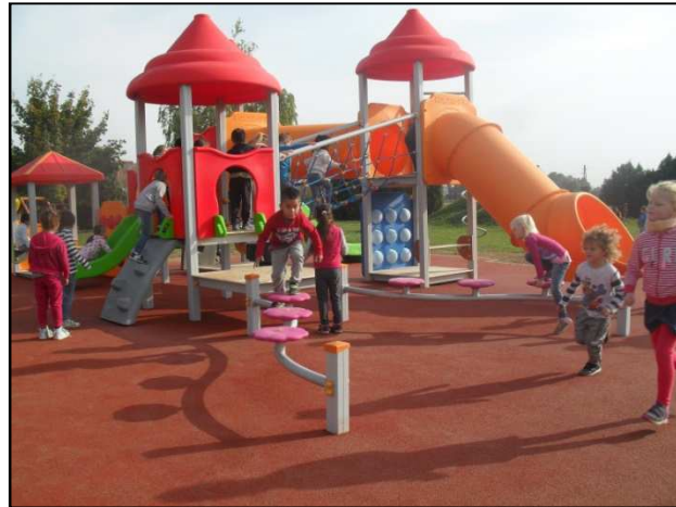
Gyerekek a birtokba vett játszótéren

A Zalacomári Napközöttthonos Óvoda játszótérének bővítési munkálatait szeptember első napjaiban kezdte el a kivitelező. A gyermekek figyelemmel kísérhették az udvar elkerített részén zajló munkafolyamatokat: alap kiásása, betonozási munkák, játékelemek összeszerelése és telepítése, ütésálló burkolat kialakítása, árnyékoló napvitorla felhelyezése. Nap, mint nap sóvárogva tették fel a kérdést: „Mikor lesz már kész?”