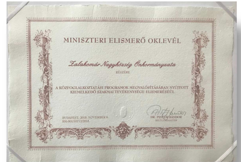
Dr. Pintér Sándor Belügyminiszter elismerő oklevele