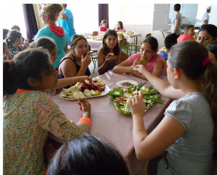
Az egészséges életmód kapta a főszerepet azon a családi napon, amelynek megrendezésére az utolsó tanítási napon került sor.

A rendezvényen nem csak a gyerekek, de a szülők is aktívan kivették a részüket a különböző programokban. A megnyitó után zenés torna következett, majd apa-fiú focimeccs, és anyalánya röplabdameccs és kötélhúzás vette kezdetét. A sportnap kísérő programjaként az ebédlőben zöldségeket és gyümölcsöket lehetett kóstolni.