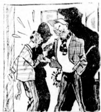
A többj: Ah, mily eszmos revolveresekd van. öregem, talán születésnapodra kaptad?

A jelentés adatai szerint a balatonszabadi, balatonalmádi és hivószelgyi gyermekszanatóriumokban tavaly 2852 gyermeket gondoztak a Salyvator rendház irgalmas nővérei és beszélt tanerők 87,196 ápolási napon. A Zsófia 3. intézetének szezonuzeme 400,148 pengót igényel, amelynek egyrésze ezédig fedezetlen. Rákosi Jenő jelmondata zárja be a jelentést: "Akinék Isten adott, adjon a gyermeknek. Mert aki a gyermeknek ad, az az Istennek ad." Adományokat a Zsófia sanatóriumok javára szerkesztőségünk is elfogad.