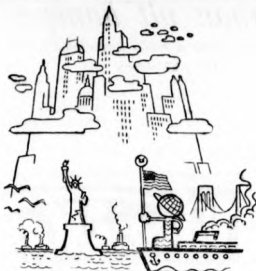
Hermérföldes csizmánk új világba toppan, Műveltő ritmusa a fölünkbe dobban, Felhőkarcólóktól kicsit srégen jobbra, Felmeltt karral áll a Szabadság szobra.