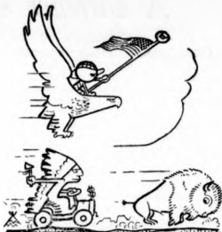
Munka, zap, szaguidás, vaanyugati vészek, Reklám, blöff, gengszterek s igazí művészt, Fílmstárok, boxalók, valamennyi títán, Niagara zaja, s a Metropolitán.