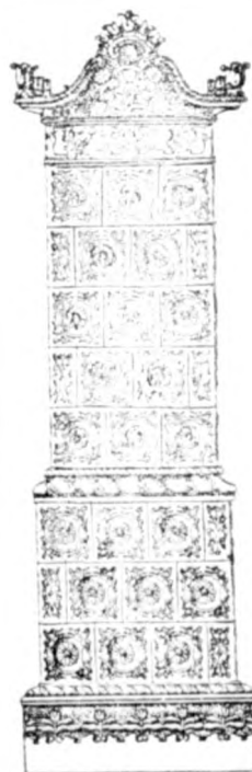
Cserépkályha raktár Nkőrösi utca 235. az udvarban

IV. tized, 265. számú Borz- és Oldal-utca sarokház , mely üzlethelyiségnek kiválóan alkalmas, eladó; értekezhetni ugyanott a tulajdonossal. 1159