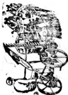
16 és megbízható aratógépet

15 évtől 65 évig terjedő időre folyósít.