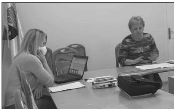
Polgármester asszony és jegyző asszony munkában

A TOP-1.4.1-19 pályázati kiírás keretében megvalósítandó mini bölcsőde kivitelezésére rendelkezésre állnak a kiviteli tervek, így következő lépésként megindulhat a közbeszerzés a kivitelező kiválasztására. A közbeszerzés keretében olyan referenciákkal rendelkező vállalkozóktól kérhető be ajánlat, akik regisztrálva vannak az EKR rendszerben. Az ülésen e feltételeknek megfelelő, környékbeli vállalkozók kiválasztására került sor.