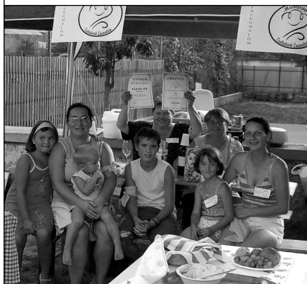
A győztes csapat