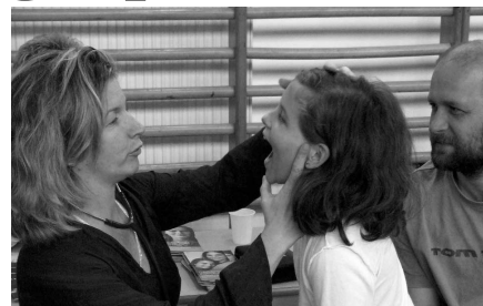
Ifjú „betegét” vizsgálja a gyermekorvos..

A fogak állapotának felmérését fogorvosunk a rendelésben végezte. Légzésfunkció mérését különösen a dohányosok igényelték. A gyermekgyógyász doktornő és a védőnő is tanácsadást tartott, sokakat segítve ezzel napi problémájuk megoldásában. A gyógyszereszek bemutatóját is sokan nézték érdeklődve, hiszen a nem receptköteles gyógyszereket, gyógyteákat, testápolókat láthatták. Veseállapot mérés, koleszterin, vércukor, vérnyomásmérésre is sor került, már aki ezt igényelte. Ápolási segédesszüközökből is széles választékot láthattak az ide látogatók. A programot színesítette az egészségügyi kérdésekből összeállított TOTO, amelyen értékes nyere-