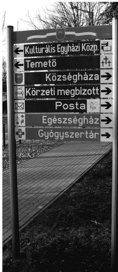
Elkészült az információs tábla a centrumban

További részleteket a plakátokon olvashatnak.