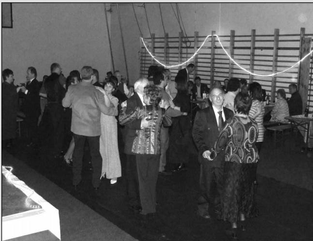
A jótekonysági bálon