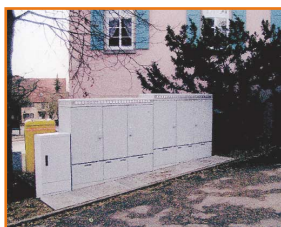
Ilyen volt és valami ilyesmi lenne...(minta)

A Kulturális Egyházi Központban várjuk településünk lakóinak ötleteit március 31-ig rajzban, maximum A/3-as méretben valamint fotókat A/4-es formátumban. A beérkezett pályaművekből május 1-én kiállítást szervezünk , ahol a lakosság szavazatai döntenek el,