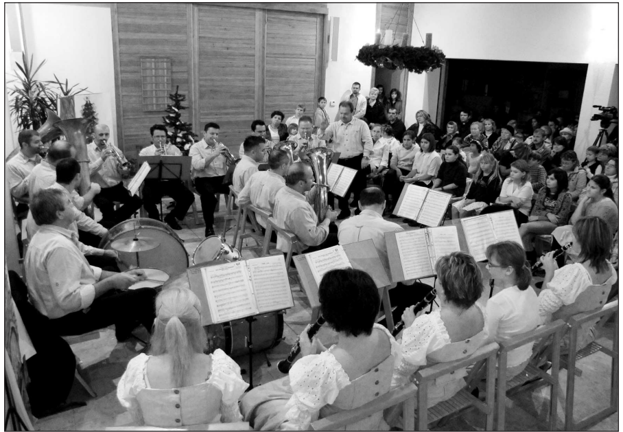
Az Adventi gyertyagyűjtáson az Alte Edecker Musikante zenekar játszik

Végül az etyeki Alte Edecker Musikanten fúvós zenekar szórakoztatta a nagyérdeműt.