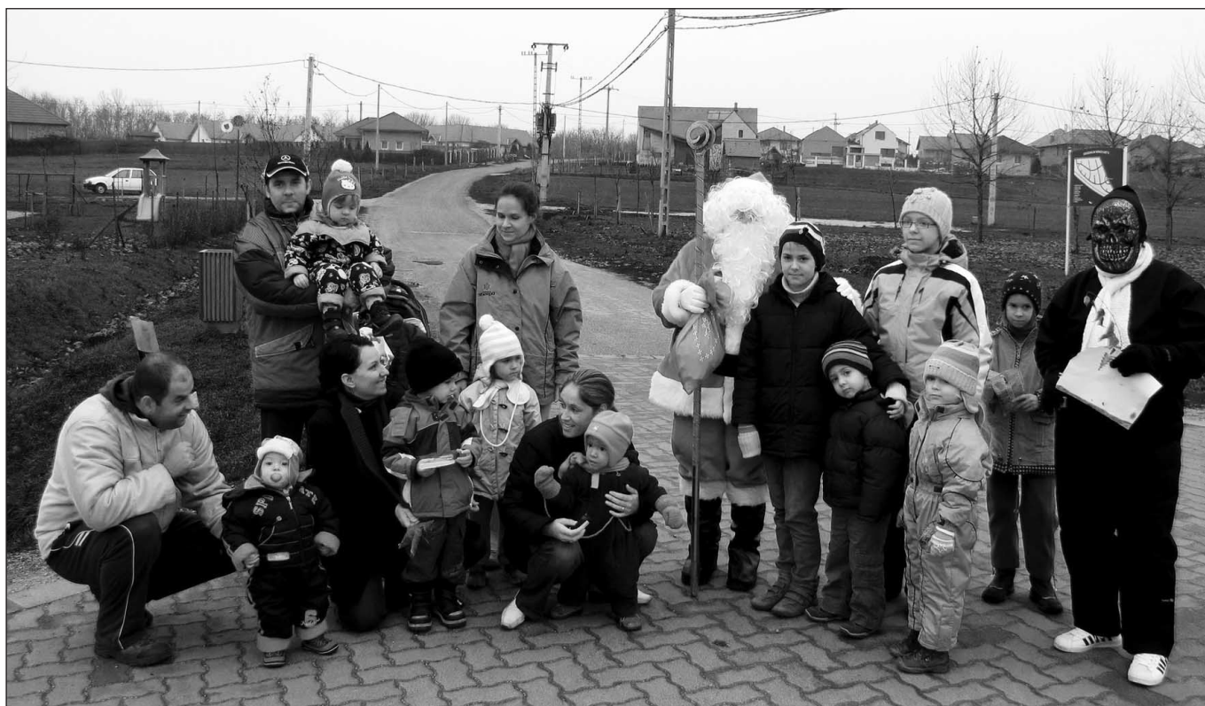
A községben a Mikulás...

Herceghalomba szokásához híven már december 5-én délelőtt megérkezett „rén-szarvas” fogatán a Mikulás, kíséretében a krampuszal. Első útja idén az Ördöglovas lejtőn lévő játszótér volt, mert ott sok gyermek várta már a szüleiével. Az utcákat járva, segítőjével, a krampuszal minden gyermeknek, akivel csak találkozott ajándékkal kedveskedett. Volt, aki verssel, volt, aki énekszóval köszöntötte a Mikulást és köszönte meg az édességet, amit a Nagyszakállútól kapott. Bár minden gyermek „jó” volt, mégis néhányan nagyon féltek és „két-ségbeesésükben” hang is alig jött ki a torkukon.