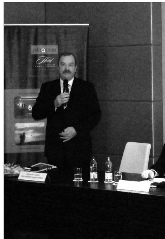
Az átadási ünnepségen

A Talentis fejlesztési koncepciója és a földrajzi elhelyezkedés együtt garanciát je-