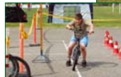
Fotók a 2010. évi május 1. rendezvényen készültek