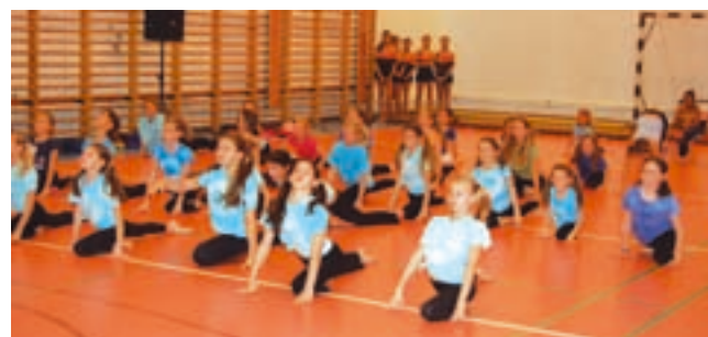
A képeken a herceghalmi tornász lányok gyakorlatának részlete látható