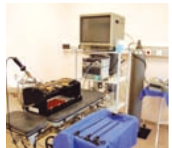
A George Berci Kísérletes és Sebészeti Műtétani Intézet herceghalmi laboratóriumának műszerei