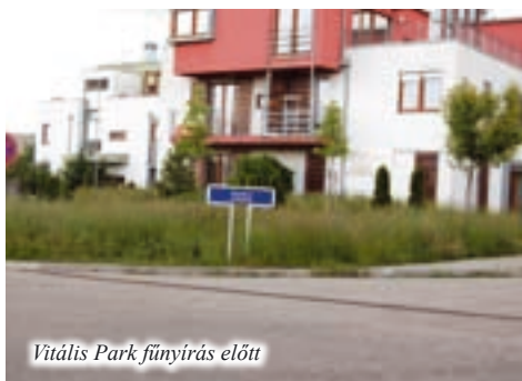
Vitális Park fűnyírás előtt

Az ott lakók (is) megelégtették a lasan derékig érő füvet és gazt a lakóparkban. Ők fizetik a közös költséget, amelyben a fűnyírás ára is benne foglaltatik, de tulajdonos Mór Park Zrt. végelszámoltatás miatt nem fizet az alvállalkozóknak. Így a gazt hónapok óta senki nem nyírta le a parkban. A lakástulajdonosok keresik a megoldást.