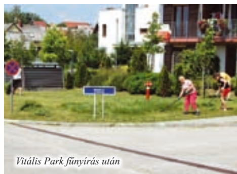
Vitális Park fűnyírás után

Az ott lakók (is) megelégtették a lasan derékig érő füvet és gazt a lakóparkban. Ők fizetik a közös költséget, amelyben a fűnyírás ára is benne foglaltatik, de tulajdonos Mór Park Zrt. végelszámoltatás miatt nem fizet az alvállalkozóknak. Így a gazt hónapok óta senki nem nyírta le a parkban. A lakástulajdonosok keresik a megoldást.