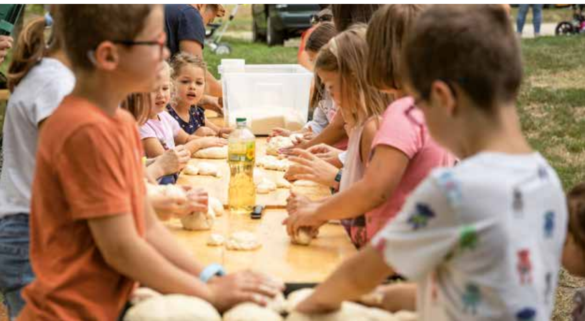
Az ünnepséget követően gyermekprogramokra és kenyérsütő versenyre is sor került

Augusztus 20. egy ünnep, amely összeköt minket. Egy kötetlek, amely mutatja, hogy sokkal több bennünk, ami közös, mint ami szétválaszt. Erősítsük ezt az érzést! Emlékezzünk rá a mindennapokban! – zárta gondolatait Cserkuti Edina.