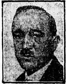
Benes csehszlovák külgügyminiszter

Prágából jelentik: Negyven nappal a választások után pénteken megalakult az új csehszlovák kormány.