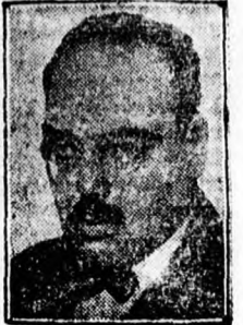
Hilderding német pénzügy- miniszter

A német kormány tagjai a memorandum dolgában minisztertanácsra ültek össze, hogy megvitassák a memorandum okozta helyzetet, amely kormányválsággal fenyeget.