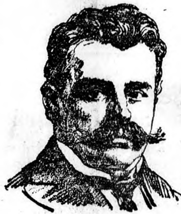
Udrzal csehszlovák miniszterelnök