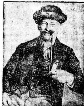
Gróf Stolberg Eberhard akit fia meggyilkolt

A nyomozás során a fiatal gróf sokáig tagadta, hogy ő követte el a gyilkosságot, de amikor egyre több és több bizonyíték merült fel bűnössége ellen, beismerte, hogy apját ő lőtte agyon . A tárgyaláson sirva erősítette meg a rendőrségen tett beismerő vallomását. Elmondotta, hogy apját nagyon szerette és nem volt