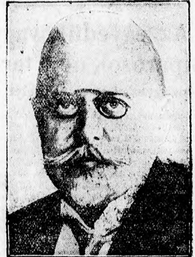
Schober bécsi rendőr-főnök, az új kancellárjelölt

amelyet a különböző alkalmakkor megejtett fegyver-