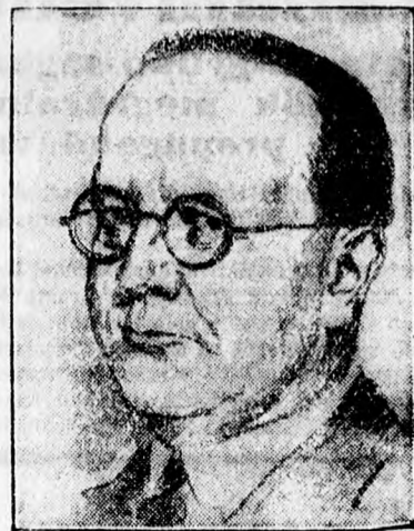
Klönne német nacionalista képviselő, aki titkos tárgyalásokat folytatott Párisban

stíusét nem tartotta szükségesnek. Az Echo de Paris megjegyzi, hogy Lippe a