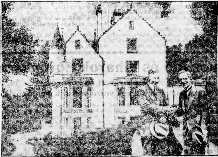
Dawes tábornok, amerikai nagykövet és Macdonald miniszterelnök találkozója. A két államférfi tanácskozása a képen látható kastélyban folyt le

A szovjetunióval való diplomáciai kapcsolatok újrafelvételének a kabinet kezében nincs ellenzéka, azonban a miniszterek többsége határozottan állást fog-