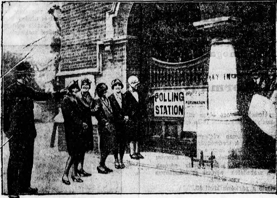
Angol „flapper”-ek — fiatal lányok — egy választó-helyiség előtt

A munkáspárt egyik legjobboldalibb felfogású politikusa J. R. Clynes. Manchesterben már két évtized óta fontos szerepet játszik a munkásmozgalomban és évek óta képviseli az alsóházban a manchesteri kerületet. Azáltal, hogy 1914-ben ő is a háborús párthoz