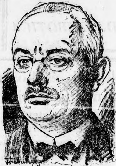
Rintelen, stájerországi tartományfőnök, a kancellárjelöltek között emlegetnek

A gyűlésen határozati javaslatot fogadtak el, amely a lakóvédelmi törvény változatlan fenntartását és a nagyobb lakásokra vonatkozó ugynevezett szabad meg egyezés felfüggesztését követeli.