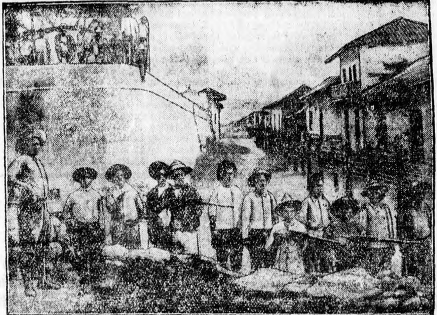
Uccai harcok Montereyben, Mexikó egyik legnagyobb városában