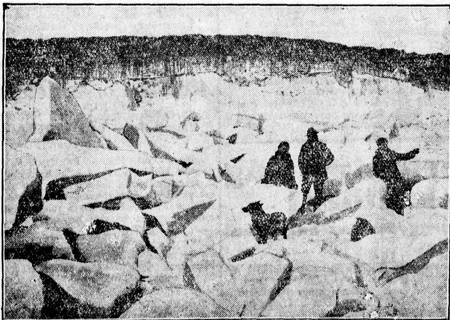
Északsarki hangulat a Keleti Tenger partvidékén

Ezt természetesen nem a levegő hőmérséklete, hanem közvetlenül a hőmérő felmelegedése okozta. Az újabb szibériai fagyhullám következtében Budapest szénellátása ismét rosszabbra fordult, miután a szükségesnek megfelelő napi kétszáz vagon helyett csütörtökön már csak huszonnégy vagon szén érkezett Budapestre. A lengyel vasuti vonalakon súlyos forgalmi zavarokat idéznek ugyanis elő a hófúvások és a magyarországi vasuti forgalomban is zavarok vannak. Az államvasutak külön mozdonyokat küldenek a határra, hogy a szénrakományokat behozzák. Budapest vízellátásában is újabb zavarok álltak be és sok házban napok óta nincsen víz, mert a megolvastított csövek újból befagytak.