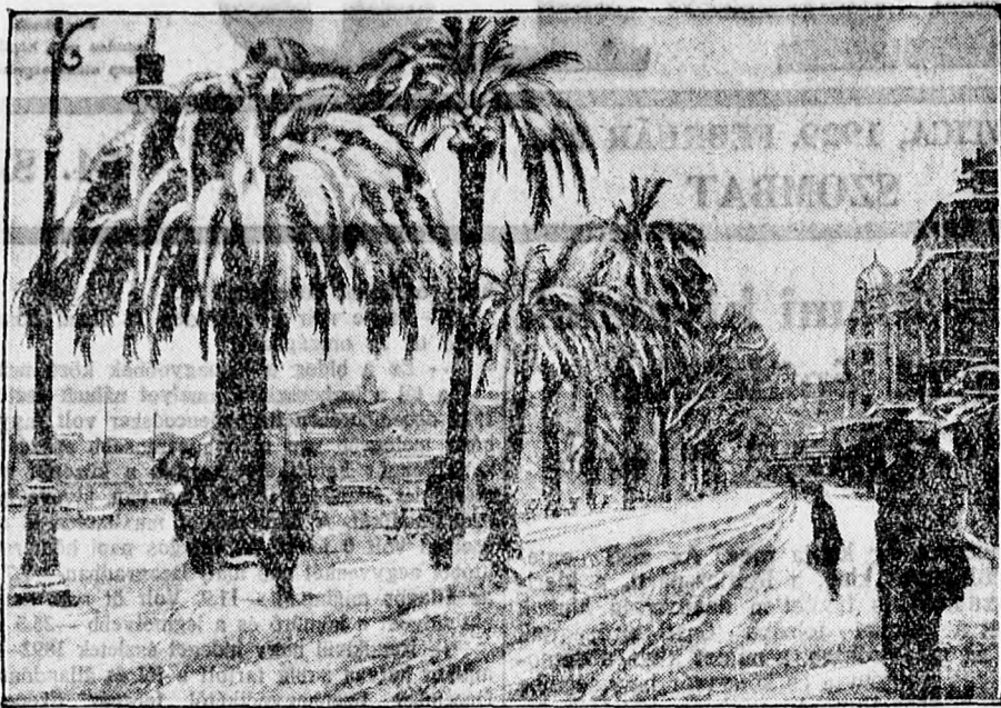
A Riviera hó alatt, Cannes pálmáit hó borítja

Ausztriában a hideg körülbelül ugyanofyan foku, sok helyen még négy-öt méter magas a hó. A vasuti forgalom Görögország legnagyobb részében szünetel és a szenátusi választásokat is kénytelenek voltak elhalasztani március 3-ikáról április 21-ikére. A Strumica völgyé-