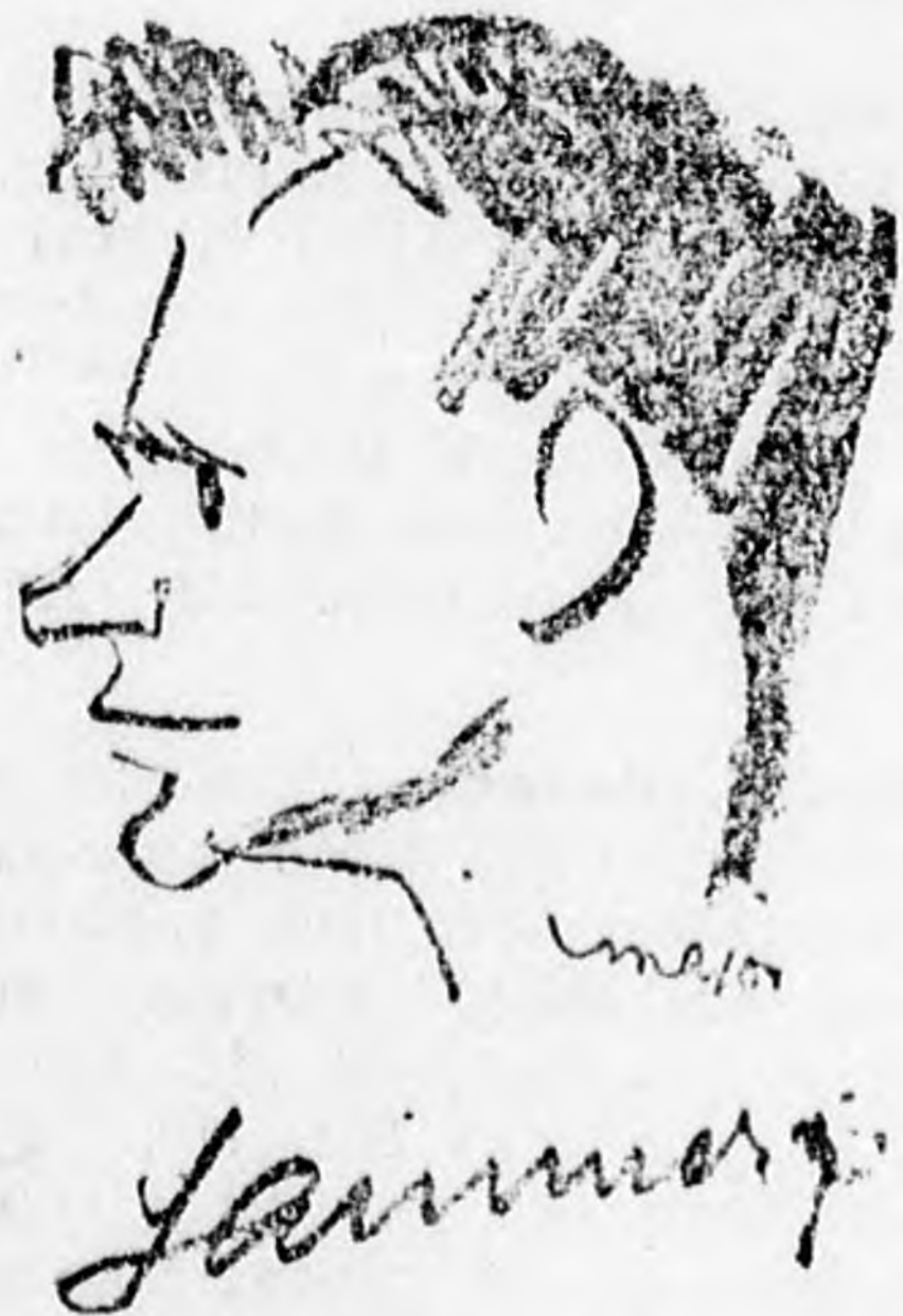
Lammis német sprinter

Az első nap hőse nem Kuck volt, az amerikai izomkolosszus, aki sulyban világrekordot javított, hanem Nurmi. A finn futóról egy év óta olyan hírek voltak, hogy letört, megöregedett, már semmit