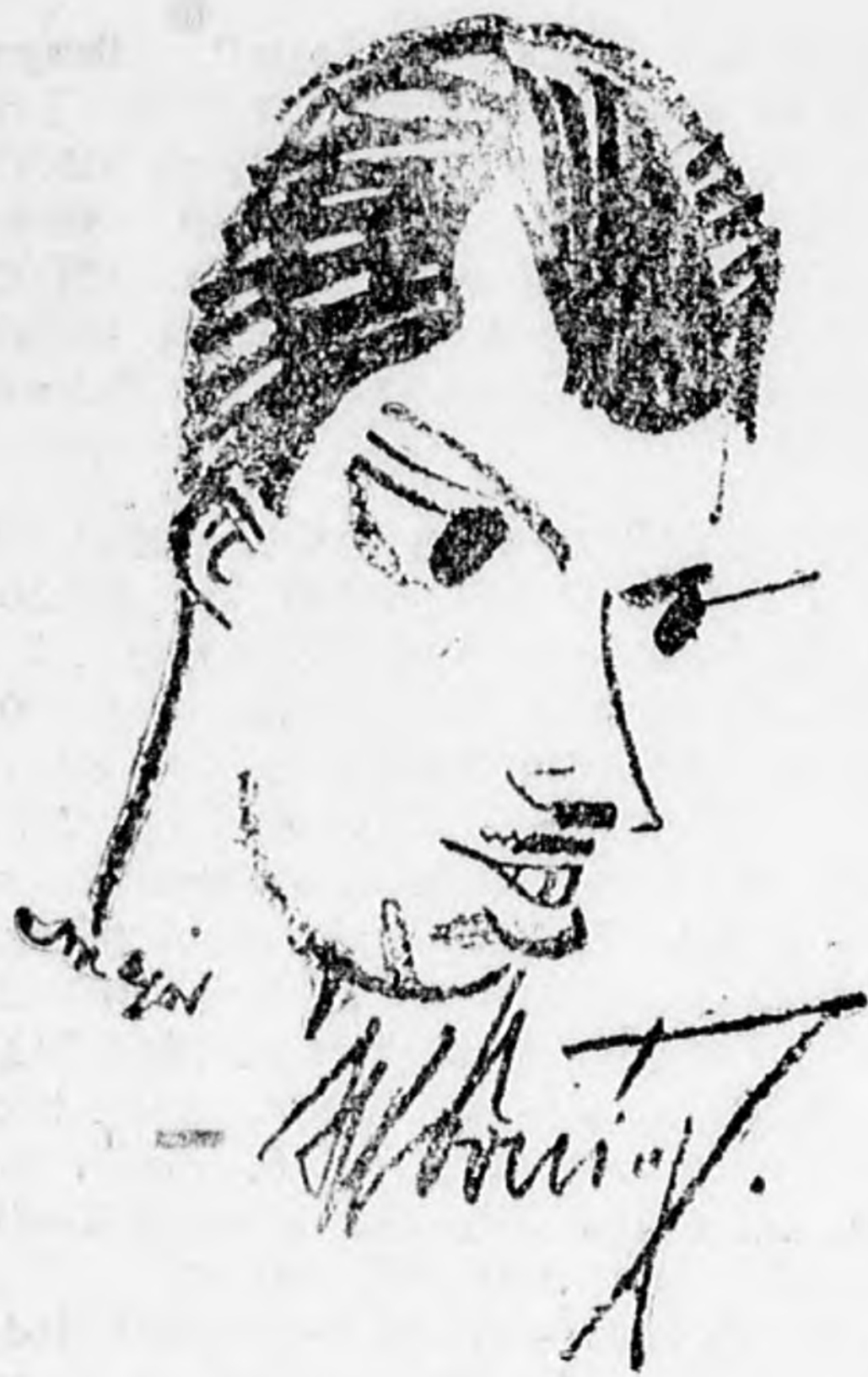
Kornig német sprinter

célba, halottféhéren. Nurmi viszont a céltól minden pihenés nélkül egyenesen beszaladt az öltözőbe, mint aki pár száz métert humlizott csupán. Mindenkinek lát-