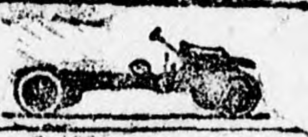
Egytonnás típus ár. 2.900

Ha megbízható és gyors szállítási esz- közre van szükségetek, ha kiadásaitokat csökkenteni, a bevételölteket fokozni akar- játok, szerezzenek be még ma egy Ford teherautót.