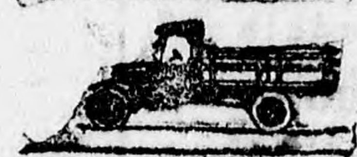
Lapos form lassúdhét oldalalakkal Din. 43.600