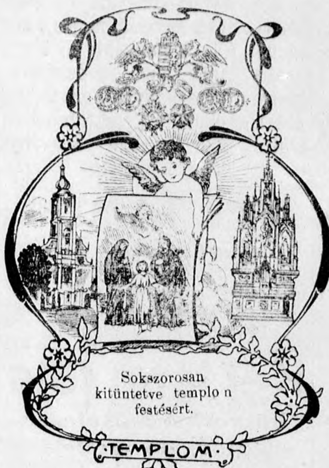
Sokszorosan kitüntetve templon festésért.