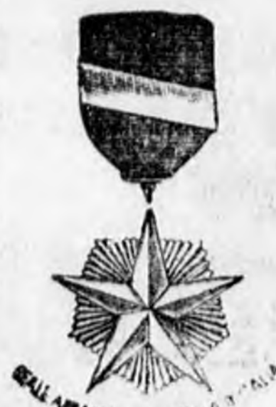
1898. évben tiszteletbeli tagga megválasztva